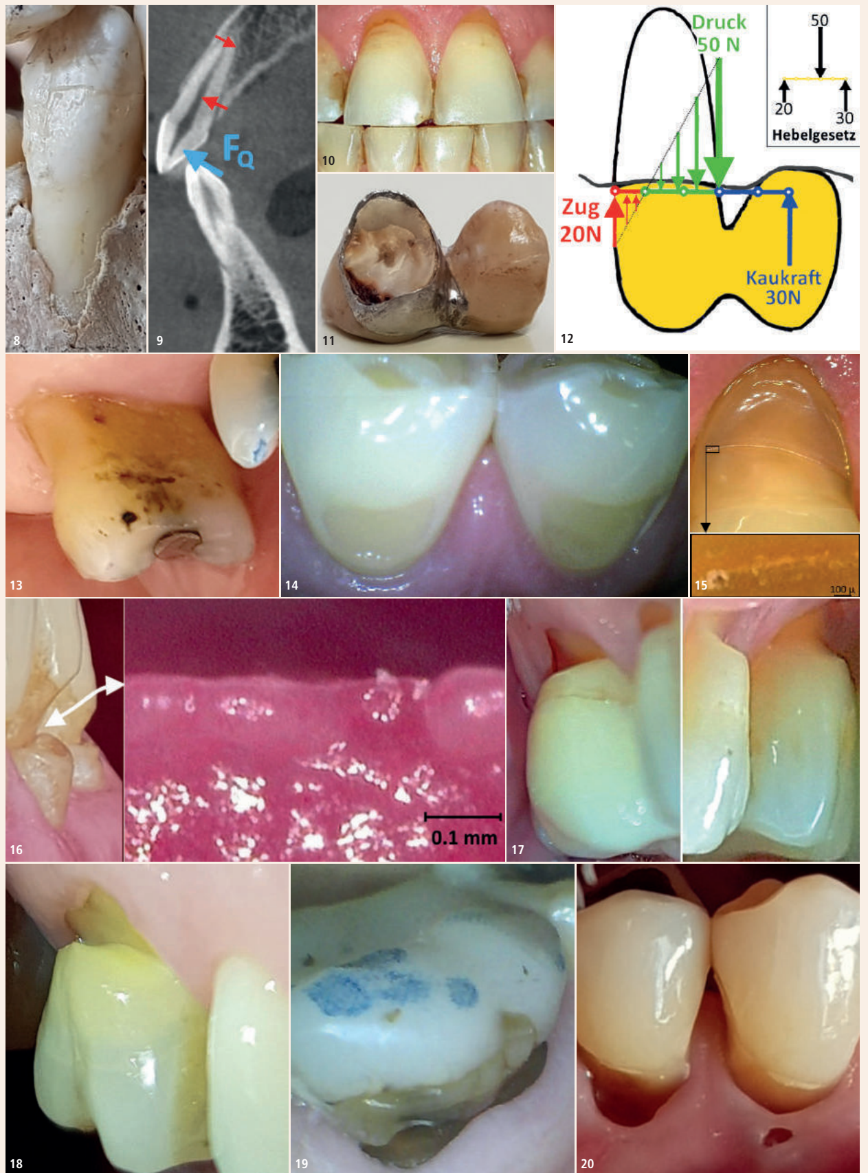
Abb. 8: Die papierdünne Außenwand einer Alveole. – Abb. 9: Die Elastifizierung der Zahnhalsregion durch die Pulpakammern. – Abb. 10: Rezessionen bei 1+1 wegen Attrition. – Abb. 11: Rissbildung im Zahnhals wegen Überlastung. – Abb. 12: Hebelkräfte bei einer Fliegerkrone (Skizze Gabriel Weilenmann, Masch.-Ing., ETH). – Abb. 13: Flacher kaltempfindlicher palatinaler Zahnhalsdefekt. – Abb. 14: Flache symptomlose bukkale Zahnhalsdefekte. – Abb. 15: oben: Beginnende Kerbbildung durch eine Linienkorrosion bei Zahn 4+; unten: Lochfraßkorrosion im Kerbgrund. – Abb. 16: links: Keilförmiger Defekt bei –2; rechts: Impregum-Abdruck des Kerbgrunds mit Zeichen einer Lochfraßkorrosion. – Abb. 17: Tiefe Zahnhalsdefekte bei 65+56 wegen starkem Bruxismus und fehlenden 4+–4. – Abb. 18: Haarriss im Kerbgrund eines vitalen 6+ mit maximalem Abrieb zwischen den beiden Spannungsmaxima des Schmelzrandes und des Kerbgrundes. – Abb. 19: Haarriss im Kerbgrund eines devitalen –6. Der Aufbau wurde 2012 gemacht. Die Patientin kam seither nur noch zur Prophylaxe-Assistentin, welche ihr mehrmals eine sehr gute Mundhygiene attestiert hat. Unter einer Krone wäre der Haarriss kaum sichtbar geworden. – Abb. 20: Gingiva überwächst die Zahnhalsdefekte bei 54–. Man beachte den Zahnstein im Loch der Gingiva.

Im Alter (Patient 76-jährig) nimmt der Schwung beim Zähneputzen ab. Dann erholt sich die Gingiva bei einer Rezession und beginnt nicht selten, über den Zahnhalsdefekt zu wachsen (Abb. 20). D1